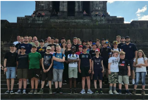
Das Artland am Deutschen Eck in Koblenz.

Einsam und verlassen hat er gewirkt, der Zeltplatz der Kreisjugendfeuerwehr Osnabrück in Rhens. Keine lachenden Kinder, keine schreienden Betreuer, keine Musik – gar nichts. Der Grund dafür lässt sich recht leicht erklären: Der Montag ist, wie auch die kommenden beiden Tage, für das Ausflugsprogramm vorgesehen. Das bedeutet: Die etwa 450 Teilnehmer sind in drei in etwa gleich große Gruppen aufgeteilt worden und zu drei verschiedenen Ausflugs-