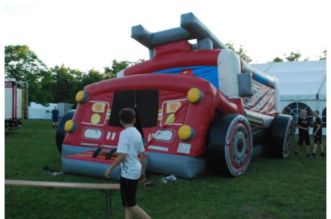
Für kleine und große Kinder: die KJF-Hüpfburg.

zielen aufgebrochen. Die Altkreise Melle und Wittlage sind in den Freizeitpark Phantasialand, der Altkreis Bersenbrück zur Stadtrallye nach Koblenz und der Altkreis Osnabrück gemeinsam mit unseren Gästen aus Olsztyn zu einer Kanutour aufgebrochen. Bei schon fast zu sonnig-warmem Wetter hatte jeder dieser Programmpunkte seinen eigenen Reiz: Die Kanufahrer sprangen teilweise zur Abkühlung in den Fluss, auf dem sie trieben. Die Koblenz-Touristen hatten die Chance, eine der schönsten Städte Südwestdeutschlands bei allerbestem Postkartenwetter zu sehen. Und das Phantasialand steht als Freizeitpark sowieso sehr hoch im Kurs von Kindern. Erst nach und nach kehrten die Teilnehmer am späten Nachmittag zurück auf den Zeltplatz – wo die Kreisjugendfeuerwehr ihre Hüpfburg aufgebaut hatte. Den Rest des Abends nutzten alle zur freien Verfügung.