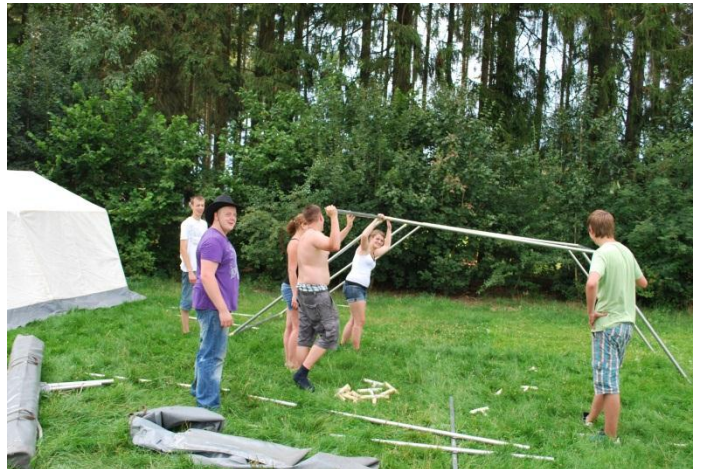
Arbeitsteilung: 2 arbeiten, 4 schauen zu

Besonders das Hochziehen des großen Essenzeltes samt Einrichtung und Musikanlage stellte dabei wie immer eine besondere Herausforderung dar. Mit wenig Routine, dafür aber mit viel Enthusiasmus und Muskelkraft konnte letzten Endes aber auch diese Mammutaufgabe zufriedenstellend beendet werden.