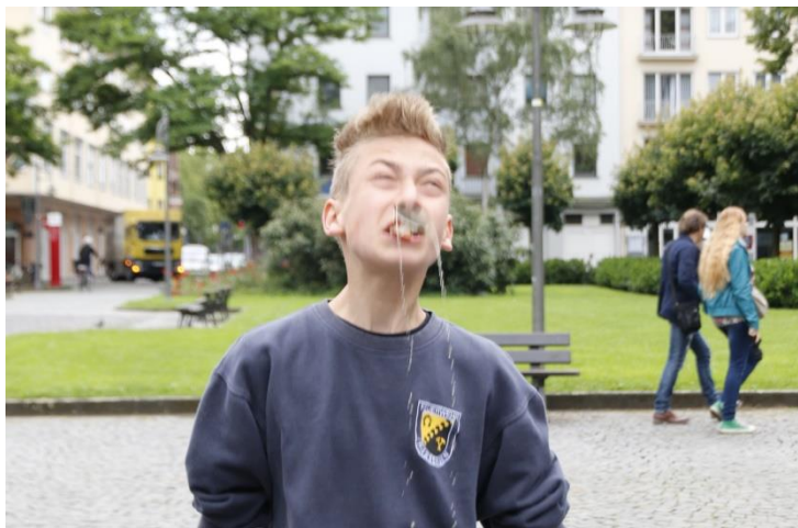
Vollste Konzentration beim Teebeutelweitwurf

Das Spielchen vom Montag wurde auch am Dienstag fortgeführt. Das Lager teilte sich in drei Gruppen, die jeweils die Frankfurter Flughafenfeuerwehr besuchten, sich an einer Stadtralley beteiligten oder per Sessellift den Rhein in seiner vollen Pracht bestaunen durften, um anschließend beim Geocaching eine gute Spürnase unter Beweis zu stellen, was den Gruppen einiges abverlangte.