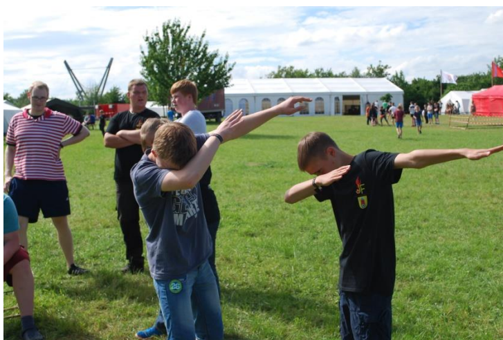
Diese beiden beherrschen den Dab in Perfektion

Dementsprechend ruhig war es den Vormittag über auf dem Platz. Als die Jugendlichen im Laufe des Nachmittags ihre Zwischenheimat in Rhens wieder erreicht hatten, vertrieben sie sich die Zeit bis zum Abend mit typischen Zeltlager-Spielen. Überraschendes Wetter sorgte für den Rest Motivation zur guten Laune.