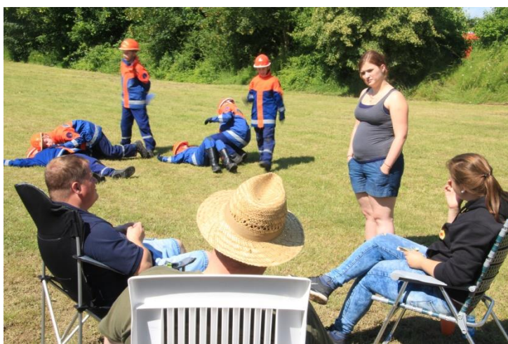
Wie beim VoKuHILa: Business in the front, party in the back.

Bereits am Vorabend stand für ein gutes Drittel der anwesenden Anwesenden eine nervenaufreibende Nachtwanderung auf dem Plan, von deren Qualität sich am Dienstagabend die nächste Truppe überzeugen durfte. Selbst unser Kreisjugendfeuerwehrwart befand: „War ganz gut!“, ehe er nervös zitternd in Richtung seines Nachtlagers aufbrach.