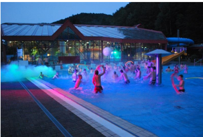
Die Feiernden gaben sogar einen „Harlem Shake“ zum Besten

Am Nachmittag kehrten die Ausflügler wieder in die Schlammgrube auf den Zeltplatz zurück. Nach dem warmen Abendbrot wurde die Freibadanlage zur Partymeile, der Pool zum Dancefloor umfunktioniert und ein rauschendes Fest gefeiert. Alle Teilnehmer hatten sichtlich Ihren Spaß an der Sache.