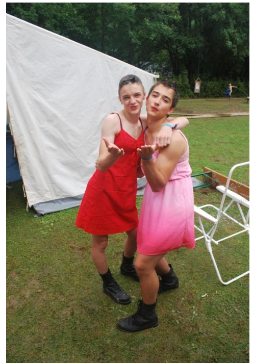
Still a better Love-Story than „Twilight“