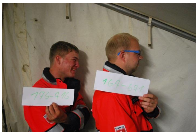
Auch von der Seite hochgefährlich!