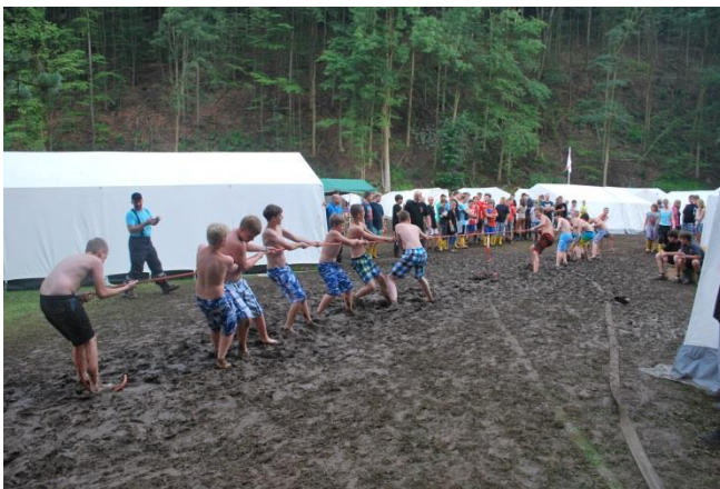
Tauziehen im Schlamm

Im Anschluss daran trugen, zur allgemeinen Belustigung, die Jungs aus Ostercappeln bei, indem sie in der Schmöttke ihre Kräfte beim Tauziehen miteinander verglichen. Welches Team die begehrten Titel nach Hause holte stand zu Redaktionsschluss noch nicht fest.