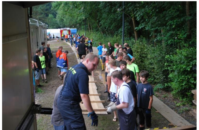
Alle packen mit an, um im Kampf gegen die Schmöttke die Oberhand zu behalten

Die meisten Teilnehmer nutzten den unverhofften Freiraum im Terminkalender damit, ins Schwimmbad zu gehen. Währenddessen machten sich die Lagerleitung und einige Betreuer auf, um Herr über das Schlamm-Problem zu werden und organisierten Planken und Paletten. Gemeinsam wurde damit eine Straße über den Zeltplatz gebaut.